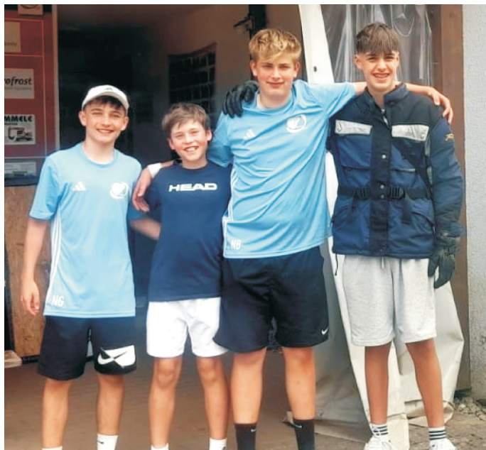
Die Junioren des TSV Offingen bezwangen den TC Reisenburg mit 4:2