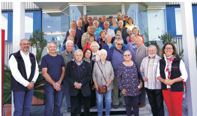
Empfang vor der Firma