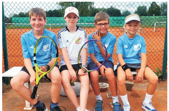
Die Midcourt-Mannschaft setzte sich erfolgreich gegen den TC Lauingen durch.