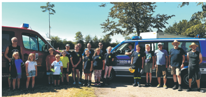
Einige Teilnehmer des gemeinsamen Zeltlagers der Feuerwehr Rettenbach und des THW Günzburg in Schabringen am Abreisetag.

Ein herzlicher Dank geht an alle die geholfen haben diese Veranstaltungen zu organisieren und zu betreuen und natürlich auch an alle Teilnehmer, die sich immer engagiert einbringen und diese Events zu einem schönen Erlebnis werden lassen.