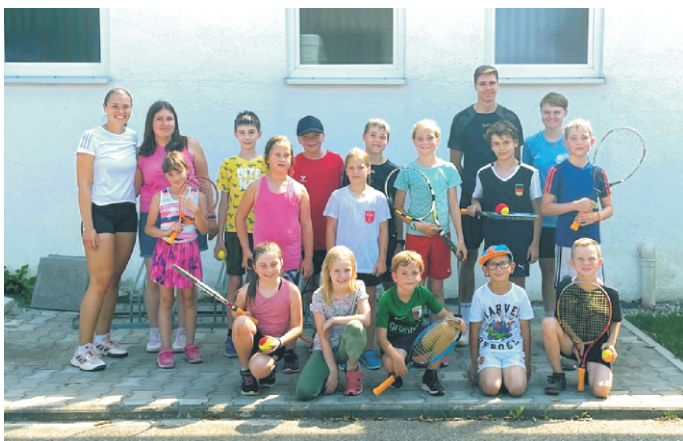
Wir freuen uns jedes Jahr am Ferienprogramm der Gemeinde teilzunehmen und so gut mit der VG Offingen zusammenzuarbeiten.