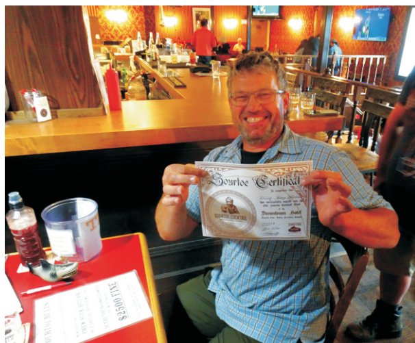
Ein Zertifikat für Whiskyverkostung