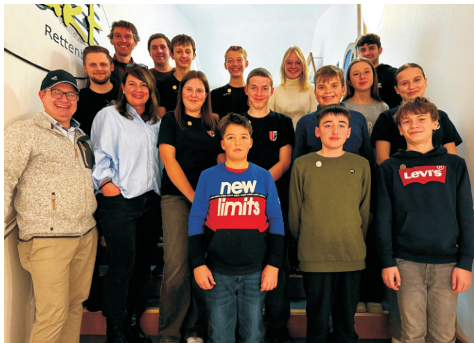
Die Jugendgruppe der Freiwilligen Feuerwehr Rettenbach zusammen mit den Jugendwarten, dem Kommandanten und unserer Bürgermeisterin.