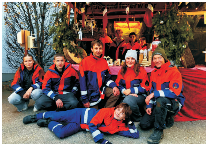
Die Jugendlichen der Feuerwehr Rettenbach vor ihrem Verkaufsstand an der Dorfweihnacht 2024.

Wir wünschen allen Mitbürgern eine besinnliche Weihnachtszeit und einen guten Rutsch ins neue Jahr.