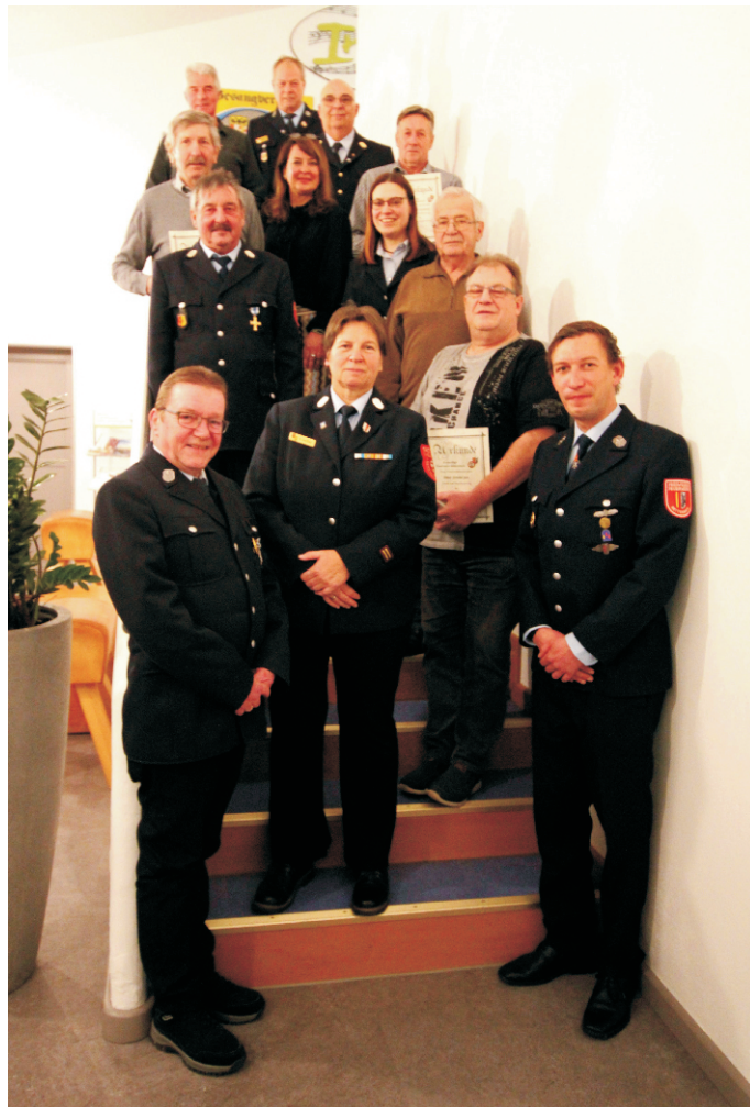
Bei der Dienstversammlung der Freiwilligen Feuerwehr Rettenbach gab es viel Lob. Im Verein wurden wieder langjährige Mitglieder geehrt.