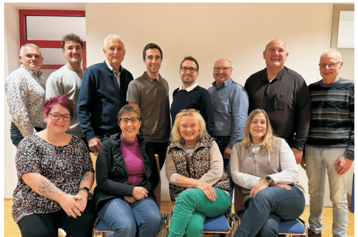
Bürgerliste Rettenbach - starke Liste für alle Bürger

Alle nominierten Kandidaten der Bürgerliste Rettenbach wünschen sich eine faire Wahl 2026, denn nur die Zukunft der Gemeinde zählt!