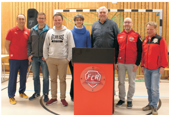
Die neu gewählte Vorstandschaft des FCR